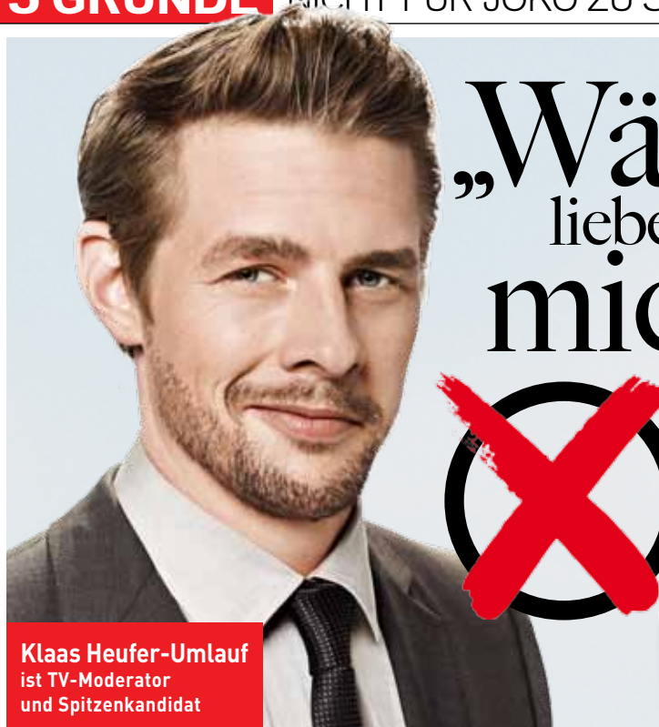
Klaas Heufer-Umlauf ist TV-Moderator und Spitzenkandidat